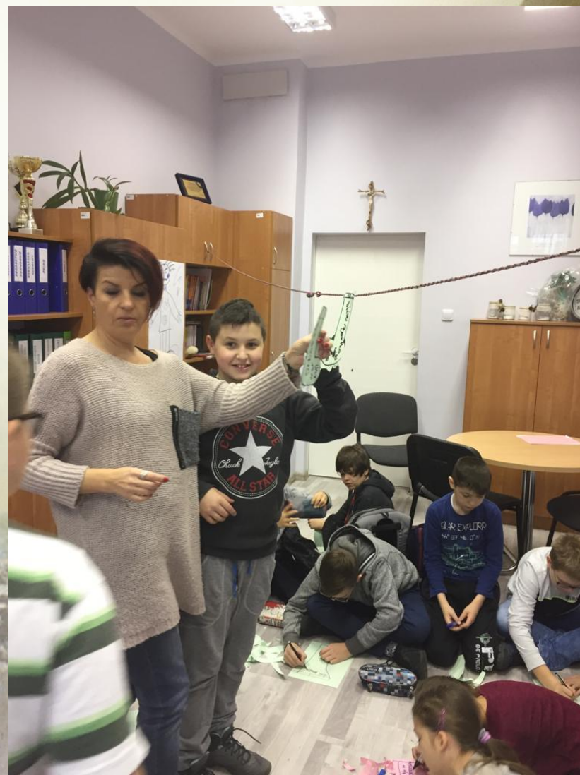
warsztaty dotyczące Treningu Zastępowania Agresji