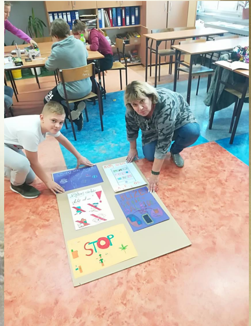
szkolny konkurs plastyczny pt. „Blżej siebie...dalej od...”