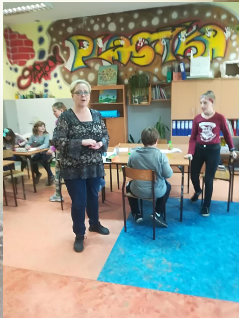
zajęcia artystyczno-socjoterapeutyczne „Aniołowo”