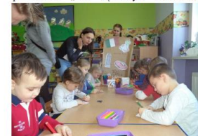
Przedszkolaki rysują flagę Włoch.