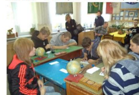
Pisanie stółką nie jest proste.

4 października kl.2b odbyła wycieczkę do Muzeum Oświaty, które znajduje się w Pedagogicznej Bibliotece Wojewódzkiej. Dowiedzieliśmy się jak wyglądała szkoła w czasach naszych dziadków i rodziców. Zobaczyliśmy stare podręczniki, zeszyty, przybory do pisania. Spróbowaliśmy nawet pisać taką stółką w oprawce. Nie było to wcale łatwe (SMS-y pisze się o wiele prościej). Najwięcej emocji wzbudziły stosowane w tamtych czasach kary np.